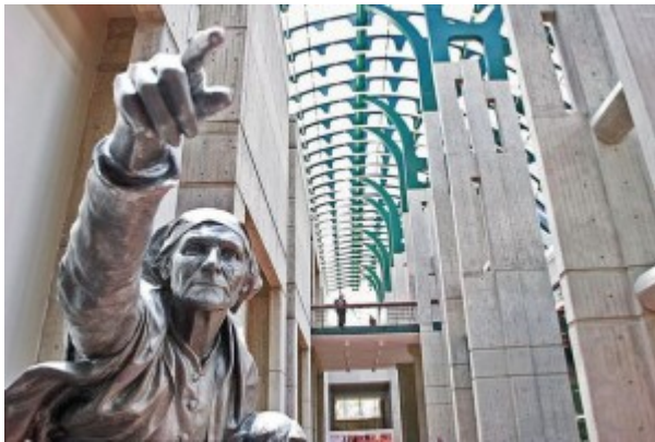
Galería de Arte Nacional