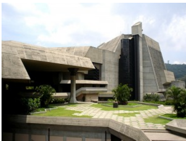
Teatro Teresa Carreño