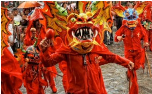
Diablos danzantes del Corpus Christi, Patrimonio inmaterial de la humanidad 2012