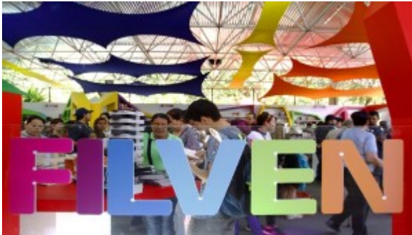
Feria Internacional del Libro

A través de esta línea de acción se dirige y hace seguimiento a las políticas orientadas a la promoción de la lectura, el desarrollo y mejoramiento de la producción editorial y gráfica nacional, así como la defensa de los derechos intelectuales.