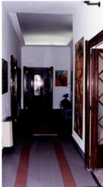
Consulado en la sede de Santa Lucia 1996