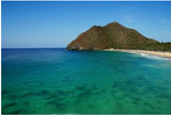
Choroní, estado Aragua

De occidente a oriente, el país cuenta con tres mil (3.000) kilómetros de playas caribeñas, sol tropical, arenas blancas, rojas o plateadas. Lugares frecuentados o territorios solitarios. Unas con aguas mansas y tranquilas; otras con olas enormes. Constituyen sitios ideales para practicar deportes acuáticos. Gran parte de estas playas se ubican dentro de áreas protegidas, como por ejemplo el Parque Nacional Mochima y el Parque Nacional Península de Paria (Estado Sucre), el Parque Nacional Morrocoy (Estado Falcón), y el Parque Nacional Henri Pittier (Estado Aragua).